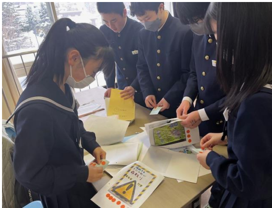
宮の森中学校 保体委員会