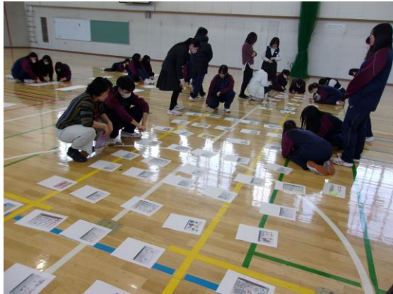
伏見 中学校 3年生