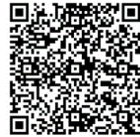
↑ 作品集はこちらから