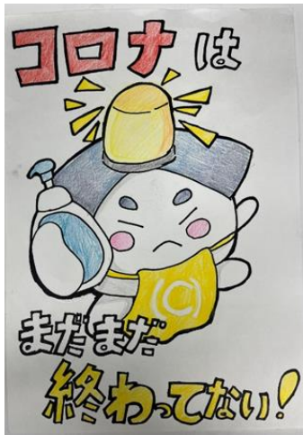
宮の森中賞 医大賞