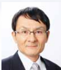
北海道大学 秋田弘俊 教授